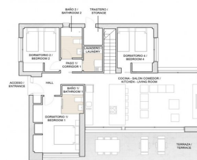
PLANTA BAJA / GROUND FLOOR

Superficie construida / Built area PROPIEDAD / PROPERTY 144,43 m 2 TERRAZAS / TERRACES 19,30 m 2 SOLARIM 92,20 m 2 TOTAL CONSTRUIDA / BUILT AREA 214,43 m 2