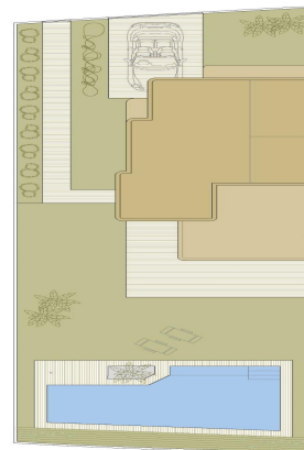
VIVIENDA TIPO V.1