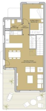
PLANTA SALVAPISCINA FLOOR