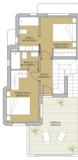
PLANTA PRIMERA / 1ST FLOOR